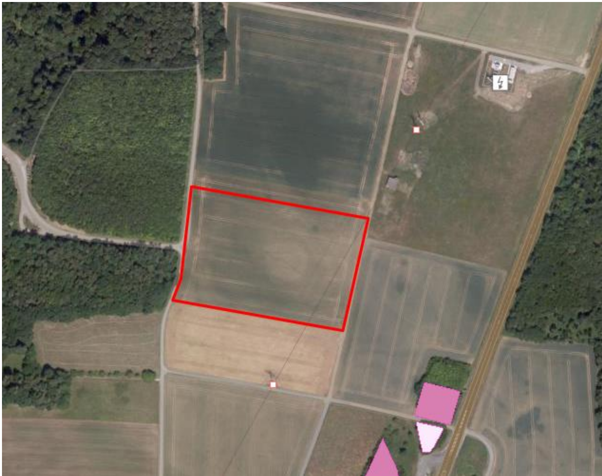
Abbildung 1: Lage des Untersuchungsgebietes (rot) mit Schutzgebieten (Biotope: rosa)